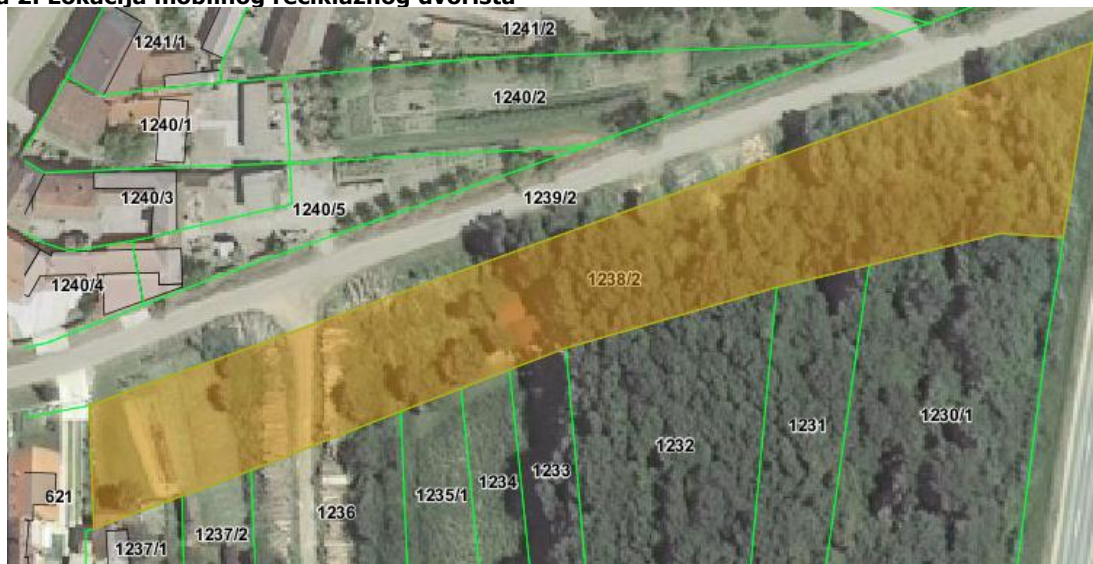
Slika 2. Lokacija mobilnog reciklažnog dvorišta

Krajem 2014. godine sklopljen je Ugovor sa tvrtkom „Runolist“ d.o.o. iz Vrpolja o izgradnji jednog mobilnog reciklažnog dvorišta na lokaciji k.č. br. 1238/2, k.o. Velika Kopanica koje je i izgrađeno u 2015.godini. Cijena izgradnje navedenog mobilnog reciklažnog dvorišta iznosila je 9.874,36 kuna (iznos s PDV-om).