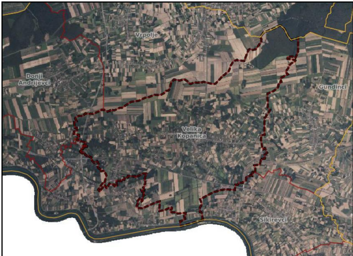
Grafički prikaz broj 1.

Granica dobivena od Državne geodetske uprave je granica obuhvata ovih VII. Izmjena i dopuna PPUO Velika Kopanica čiji je obuhvat vidljiv u modulu Informacijskog sustava prostornog uređenja (ISPU) ePlanovi https://planovi.mgipu.hr/#/auth/prostorni-plan/630/geometrija